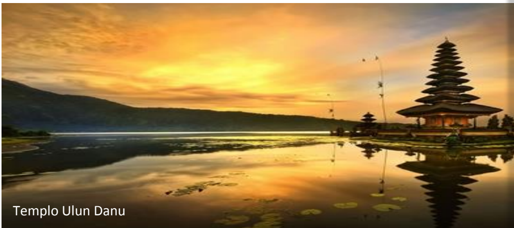
Templo Ulun Danu